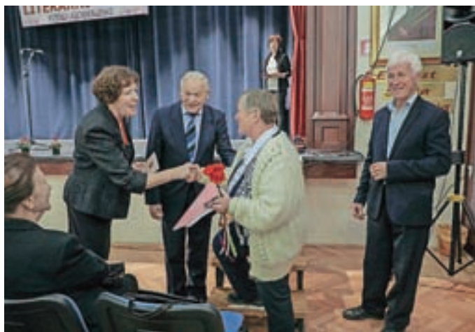
Literarni večer gorenjskih upokojencev, ki ga je gostilo DU Britof - Predoslje