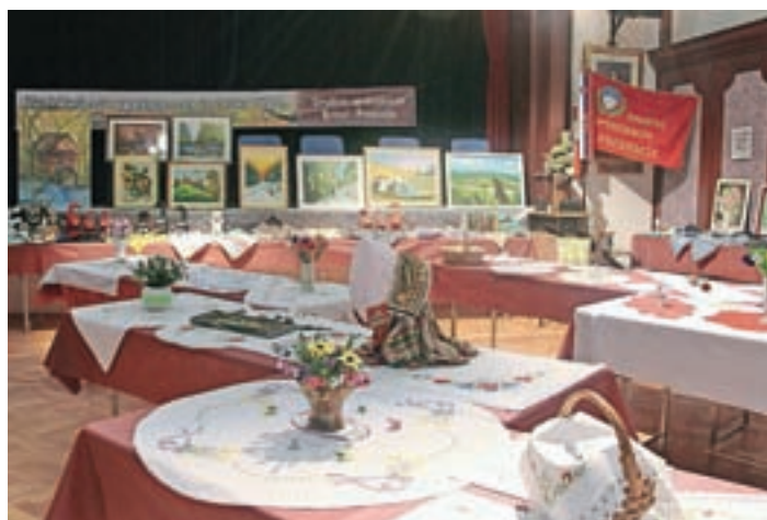
Razstava ročnih del je bila od 16. do 18. marca v dvorani Kulturnega doma v Predosljah.